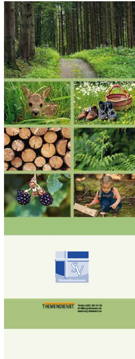
Motiv mit Logoplatzierung 348,00 €