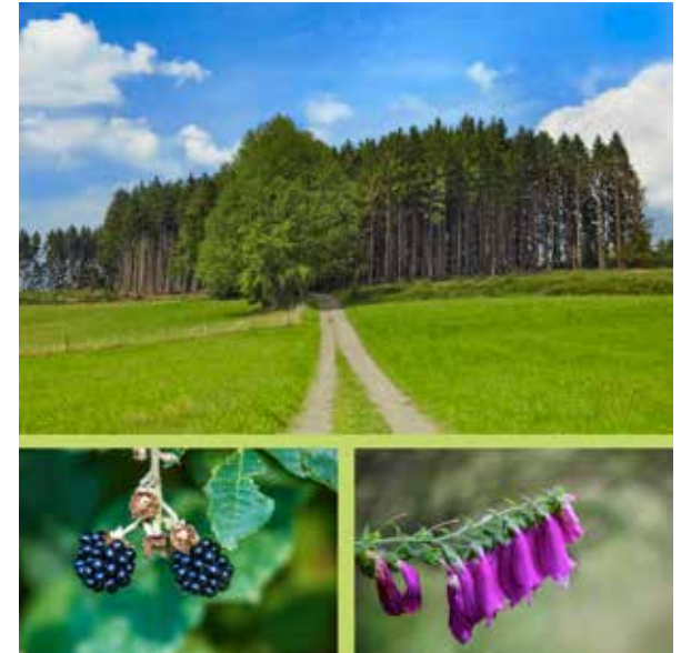
Beispiel "Wald" 120cm x 120cm