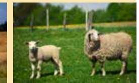
Modul 1 und 4 = 120 cm x 120 cm